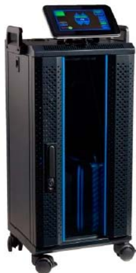
H Hygiène Solution 200-400 (Volume de pièce 200-400 m 3 )

Avec l'appareil H Hygiène 200-400 en combinaison avec la solution NeutroDes AIR prête à l'emploi, le risque d'infection par gouttelettes dans les pièces fermées peut être massivement réduit. La désinfection de surface à effet prolongé désinfecte toutes les surfaces de la pièce, de sorte que vous pouvez vous concentrer à nouveau sur le nettoyage. Ce procédé unique inactive les virus et les bactéries présents dans l'air sous forme d'aérosols - tout au long de la journée.